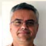
ΝΤΟΥΛΗΣ Ανδρέας ΕΘΙΑΓΕ - ΙΑΛΛΗ