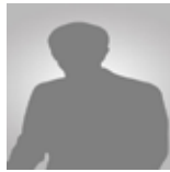
ΜΠΟΥΣΙΟΥ Ευφροσύνη Γεωπόνος, Υπουργείο Αγροτικής Ανάπτυξης και Τροφίμων.