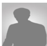
ΠΙΤΣΙΚΑ Μαρία Διευθύντρια Πιστοποίη- σης & Ανάπτυξης της TUV Hellas A.E.